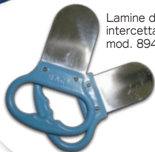
Lamine di intercettazione mod. 8940-8941